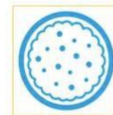
Kenya - Maïs ou riz avec haricots

Nos repas sont préparés avec des aliments facilement disponibles, de bonne qualité et enrichis en vitamines et minéraux lorsque cela est possible.