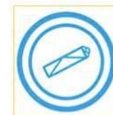
Syrie - Wrap avec des ingrédients locaux