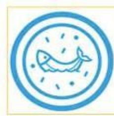
Birmanie - Riz avec poisson, viande et légumes